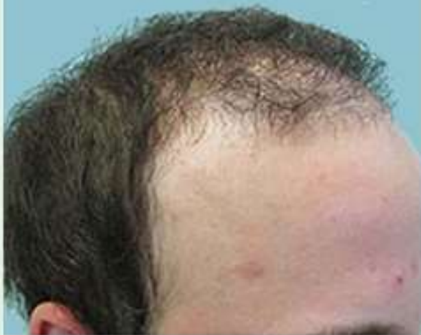
Before Treatment Normal Hair Loss