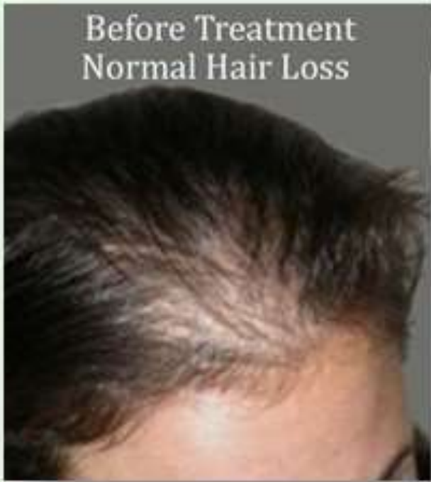
Before Treatment Normal Hair Loss